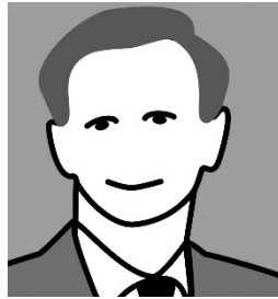
Vorname Nachname Beruf, Alter Aufgabenbereich

Lorem ipsum Blindtext Kurzvorstellung ligula eget dolor. Aenean masa. Cum sociis antique pena-tibus et magnis dis par-turient montes, nascetur ridi-culus mus. Donec quam felis, ultricies nec, pretium quis.