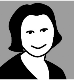
Vorname Nachname Beruf, Alter Aufgabenbereich

Lorem ipsum Blindtext Kurzvorstellung ligula eget dolor. Aenean masa. Cum sociis antique pena-tibus et magnis dis par-turient montes, nascetur ridi-culus mus. Donec quam felis, ultricies nec, pretium quis.